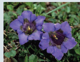
Bild: Enzianarten können sehr verschiedene Erscheinungsbilder haben.